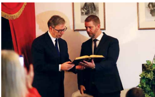
ПРЕДСЕДНИК ВУЧИЋ НА СРЕТЕЊСКОЈ АКАДЕМИЈИ