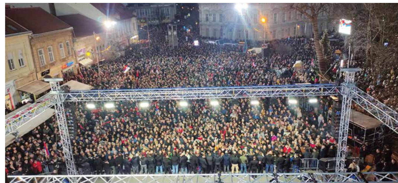
ДЕТАЉ СА МИТИНГА У СРЕМСКОЈ МИТРОВИЦИ, НА КОЈЕМ СЕ ОКУПИЛО НЕКОЛИКО ДЕСЕТИНА ХИЉАДА ЉУДИ

„На мој предлог, требало би да Влада Србије донесе одлуку да се додатно подстакне развој Пчињског, Топличког и Јабланичког округа. Да ми, као држава, плаћамо више, али и да инвеститорима дајемо веће субвенције ако долазе у ова три округа. Помоћи ћемо и око путне инфраструктуре, биће удесетостручена улагања у градњу локалних путева, како би села добила, не закрпе, већ модеран асфалт. Морамо да сачувамо југ Србије и нашег домаћина на југу Србије".