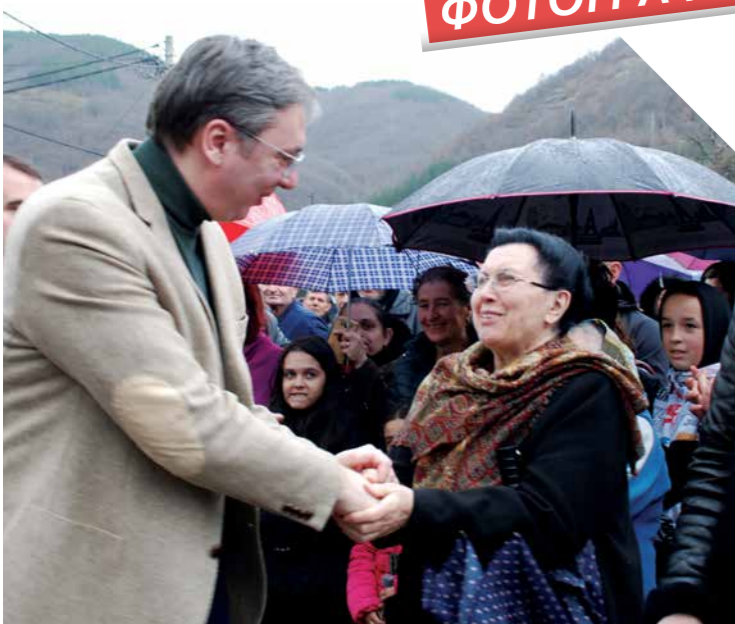
ПРЕДСЕДНИК ВУЧИЋ СА ГРАЂАНИМА ТОКОМ ПОСЕТЕ ПЧИЊСКОМ ОКРУГУ