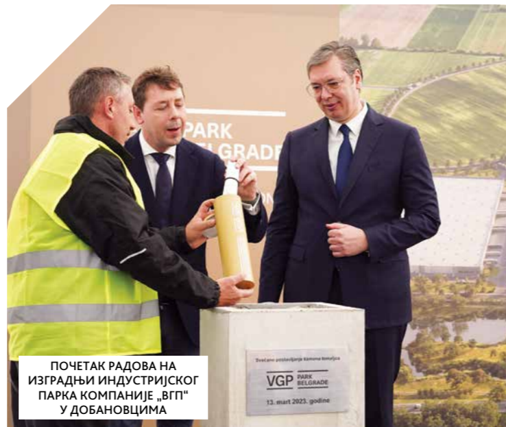
ПОЧЕТАК РАДОВА НА ИЗГРАДЊИ ИНДУСТРИЈСКОГ ПАРКА КОМПАНИЈЕ „ВГП“ У ДОБАНОВЦИМА