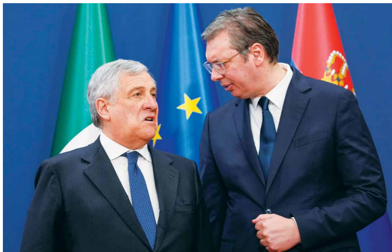
АНТОНИО ТАЈАНИ И АЛЕКСАНДАР ВУЧИЋ

„За нас је Италија искрени пријатељ, на њу смо увек могли да рачунамо и на нашем европском путу. Италија никада није била међу земљама које су вршиле притиске на Србију, већ је била ту да помогне и одшкрине врата неком договору, а не сукобима или проблемима. Молим италијанске компаније да дођу, нудимо сигуран амбијент за улагања, десет година нисмо мењали порезе, наша валута је чврста, јавни дуг 52 одсто у односу на БДП. Италијански предузетници су више него добродошли у нашу земљу”.