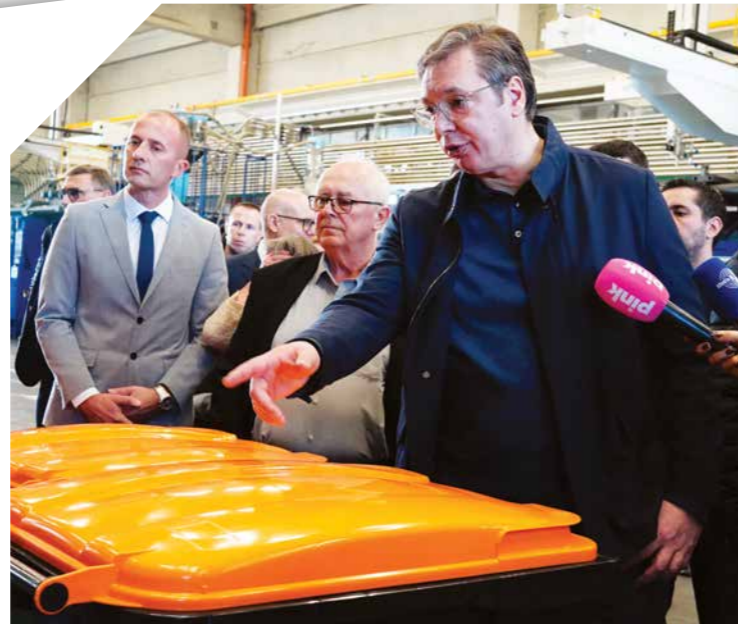
ОБИЛАЗАК ФАБРИЧКИХ ПОГОНА У ИНЂИЈИ