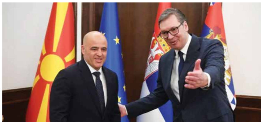
КОВАЧЕВСКИ И ВУЧИЋ

Председник Србије Александар Вучић састао се са председником Владе Северне Македоније Димитром Ковачевским, а двојица званичника истакла су да су односи двеју држава најбољи у савременој историји, те да више нема отворених питања и да је партнерство двеју држава пример за регион. Такође, истакли су да ће три документа, која се потписују током посете Ковачевског Београду, додатно оснажити сарадњу.