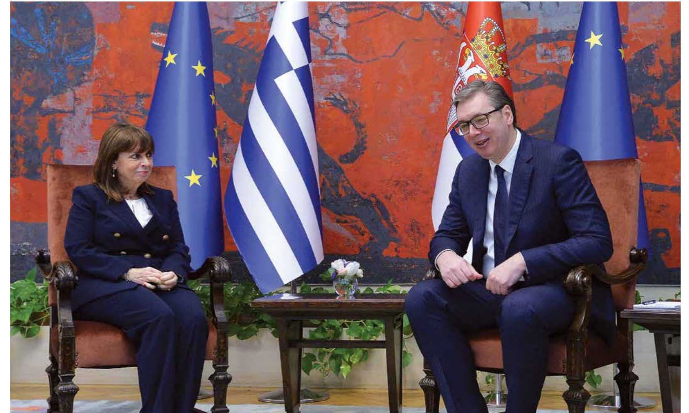
КАТЕРИНА САКЕЛАРОПОЛУ И АЛЕКСАНДАР ВУЧИЋ