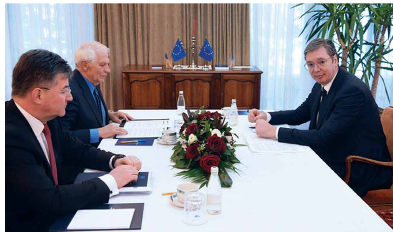
МИРОСЛАВ ЛАЈЧАК, ЖОЗЕП БОРЕЉ И АЛЕКСАНДАР ВУЧИЋ

У оквиру нове рунде дијалога између Београда и Приштине на највишем политичком нивоу, председник Србије Александар Вучић и тзв. косовски премијер Љубин Курти одвојено су разговарали са европским посредницима, које је предводио шеф европске дипломатије Жозеп Борел, а касније су одржали и трилателарни састанак који је завршен након седам сати.