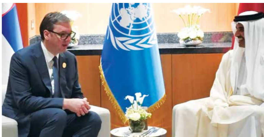
САСТАНАК СА ШЕИКОМ ТАМИМ БИН ХАМАДОМ АЛ ТАНИЈЕМ