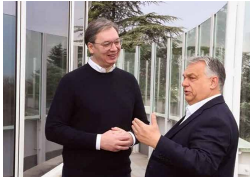
АЛЕКСАНДАР ВУЧИЋ И ВИКТОР ОРБАН

Гости Београда били су мађарски премијер Виктор Орбан и мађарски министар спољних послова Петер Сијарто, који су разговарали са председником Србије Александром Вучићем о будућој сарадњи две државе. Мађарска је тренутно пети трговински партнер Србије, а била је тринаести, што говори о њиховим великим улагањима у нашој земљи. Такође, захваљујући складиштењу нашег гаса у мађарским складиштима, имали смо велику енергетску сигурност ове зиме.